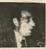
Ο βουλευτής του ΔΗΚΟ κ. Φειδίας Παρασκευαΐδης.

ΤΡΕΙΣ ΝΕΑΡΟΙ, Ο ΈΝΑΣ ΠΙΘΩ ΑΠΟ ΤΟΝ ΆΛΛΟ ΚΡΕΒΆΤΙ ΚΕΥΑΪΔΗ ΣΥΜΦΩΝΑ ΜΕ ΚΑΤΑΘΕΣΗ ΤΟΥ 2ου ΚΑΤΗΓΟΡΟΥΜΕΝΟΥ Τρεις νεαροί πήγαν να υποβάλουν αίτηση στο ΔΗΚΟ κ. Φειδία Παρασκευαΐδη, αλλά ο τελευταίος τους αρνήθηκε. Ο ένας τους έπεισε να τον σκοτώσει. Ο άλλος τον βοήθησε να φέρει τον νεαρό στο σπίτι του. Ο τρίτος τον έφερε στο σπίτι του.